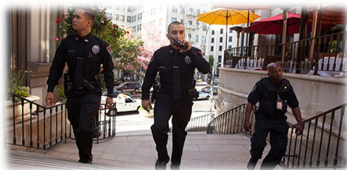
Fig. 1- Guardias de seguridad armados

Mediante un análisis orientado a la identificación y clasificación de los riesgos y amenazas estos sectores económicos determinan los Planes de Emergencia Internos y Externos (PEI, PEE) cuyos manuales contienen toda la información necesaria para el control de cada tipo de emergencia dentro de la instalación pública y zonas comerciales que puedan verse afectadas.