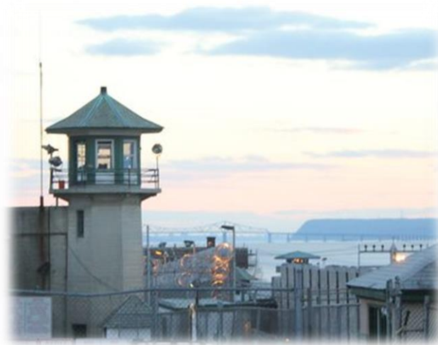
Fig. 1- Torre de guardia en la instalación correccional de Sing Sing

Mediante un análisis orientado a la identificación y clasificación de los riesgos y amenazas estos sectores económicos determinan los Planes de Emergencia Internos y Externos (PEI, PEE) cuyos manuales contienen toda la información necesaria para el control de cada tipo de emergencia dentro de la instalación pública y zonas gubernamentales que puedan verse afectadas.